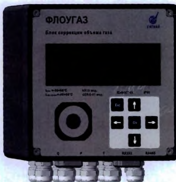
Рисунок 1 - Общий вид блока коррекции объема газа «ФЛОУГАЗ»